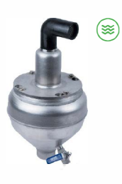
Be- und Entlüftungsventil