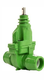
Abwasserschieber d 40