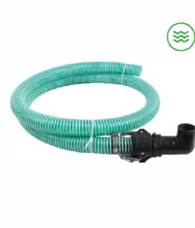
Abluftset mit Schlauch