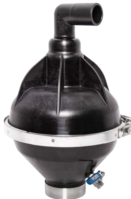
Be- und Entlüftungsventil PN 10 aus Kunststoff (Best.-Nr. 989-00)

Das geringe Gewicht des Be- und Entlüftungsventils aus PA ermöglicht eine leichte und schnelle Montage. Die Profilschelle aus nichtrostendem Stahl ermöglicht zudem ein schnelles Öffnen und Schließen des Ventils im Wartungs- bzw. Reinigungsfall.