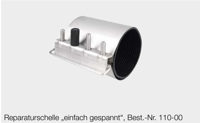
Reparaturschelle „einfach gespannt“, Best.-Nr. 110-00