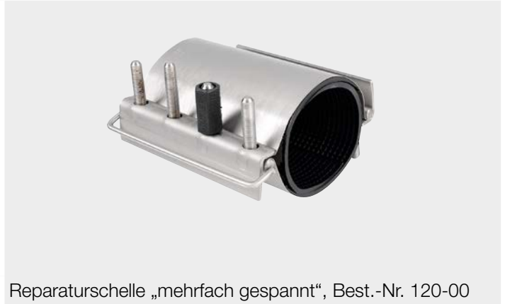
Reparaturschelle „mehrfach gespannt“, Best.-Nr. 120-00