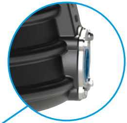
Abgang: ZAK 46 Muffe mit integriertem Steckfitting Anschluss d 40 mm

sowie in der Variante A15 (Belastung 1,5t) für Grünflächen/ Parkanlagen erhältlich. Durch den flexiblen Höhenausgleich der Wasserzähler Schachtabdeckung kann ein Höhenausgleich zwischen 0 - 30 cm vorgenommen werden. Der Wasserzählerschacht 2.0 ist in den Rohrdeckungen 1,0 m, 1,25 m und 1,50 m und mit zwei Abgangsvarianten ZAK 46-Muffe mit integriertem Steckfitting für PE-Rohre d 40 erhältlich.