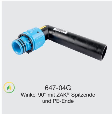
647-04G Winkel 90° mit ZAK®-Spitzende und PE-Ende