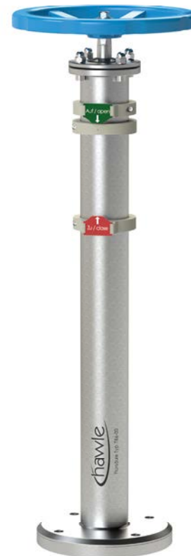
Abb. Hawle Flursäule mit Handrad und optionaler Stellungsanzeige