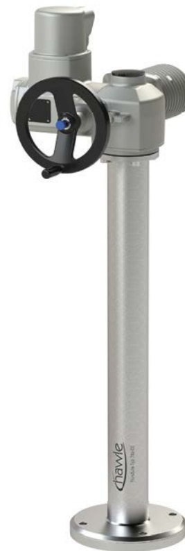
Abb. Hawle Flursäule für Stellantrieb (Stellantrieb ist nicht im Lieferumfang enthalten)